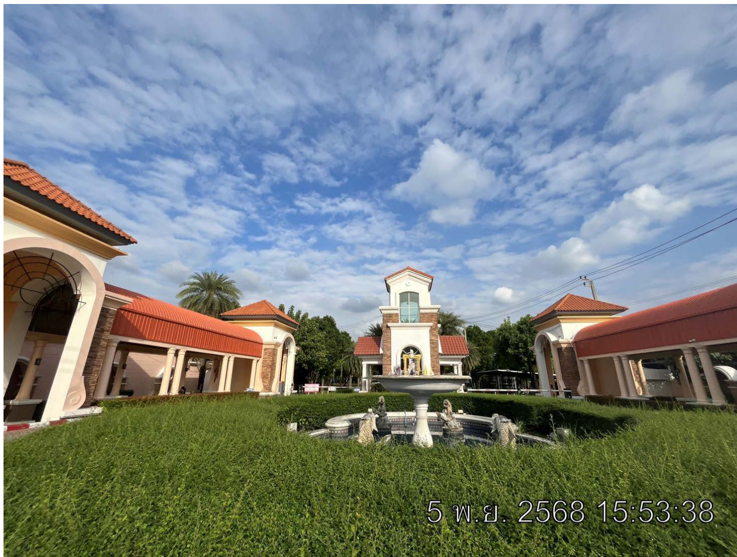
รูปที่ 1.3 สภาพหมู่บ้านในปัจจุบัน