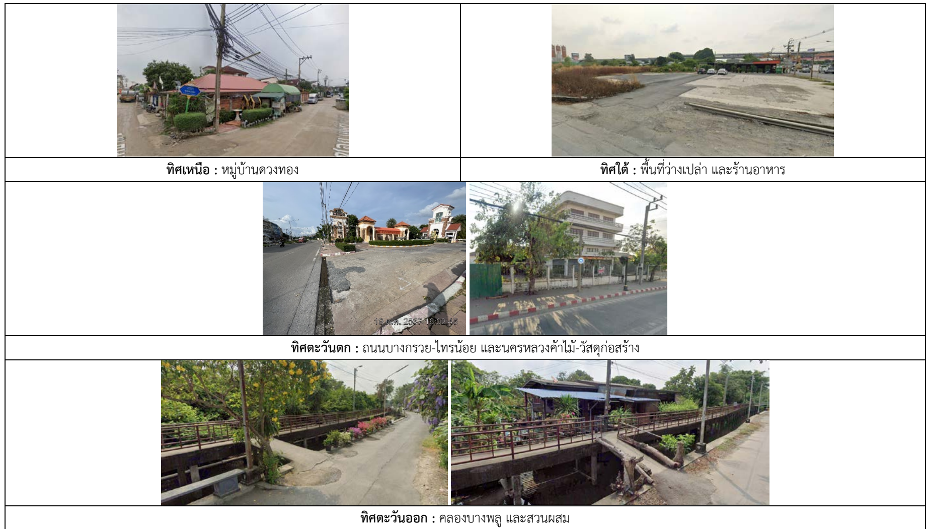
รูปที่ 1.2 แสดงการใช้ประโยชน์บริเวณพื้นที่หมู่บ้านและพื้นที่ใกล้เคียง